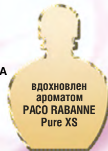
вдохновлен ароматом PACO RABANNE Pure XS

Активные ухаживающие компоненты: протеины шелка, лотос, вербена, экстракт шелкового дерева.