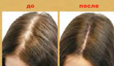
заметное улучшение после применения препаратов линии ACTIVE HairComplex

Для этого идеально подходит специальная линия ACTIVE HairComplex