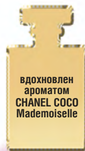
вдохновлен ароматом CHANEL COCO Mademoiselle

Активные ухаживающие компоненты: дамасская роза, франжипани, высокоэффективный увлажнитель Hydrovance.