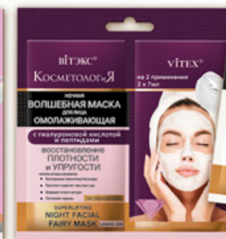
6. Ночная ВОЛШЕБНАЯ МАСКА для лица с гиалуроновой кислотой несмываемая