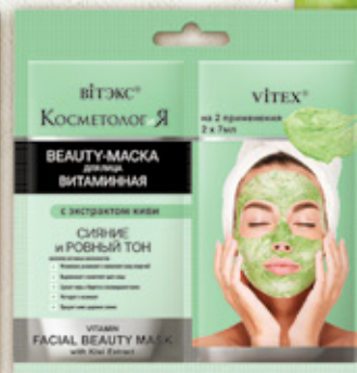
3. ВИТАМИННАЯ BEAUTY-МАСКА для лица с экстрактом киви