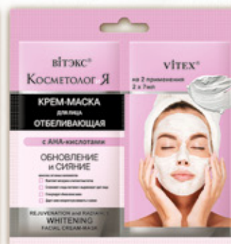
5. ОТБЕЛИВАЮЩАЯ КРЕМ-МАСКА для лица ОБНОВЛЕНИЕ И СИЯНИЕ