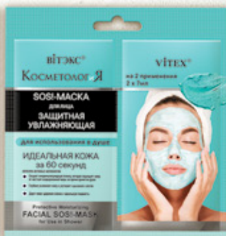
2. ЗАЩИТНАЯ УВЛАЖНЯЮЩАЯ SOSI-МАСКА для лица для использования в душе