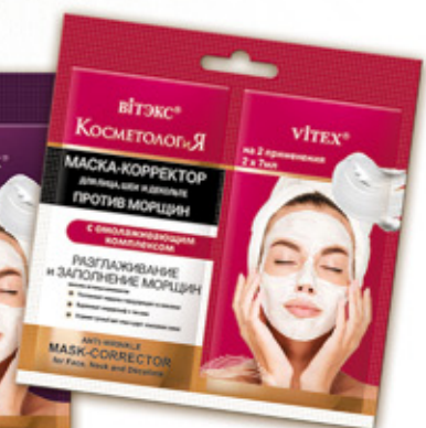
7. МАСКА-КОРРЕКТОР ПРОТИВ МОРЩИН для лица, шеи и декольте с омолаживающим комплексом

БЕЗУПРЕЧНАЯ ПО СОСТАВУ И ЭФФЕКТИВНОСТИ КОСМЕТИКА НОВОГО ПОКОЛЕНИЯ