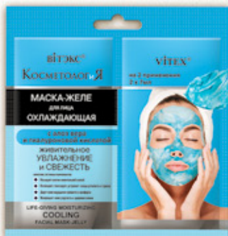
1. ОХЛАЖДАЮЩАЯ МАСКА-ЖЕЛЕ для лица ЖИВИТЕЛЬНОЕ УВЛАЖНЕНИЕ И СВЕЖЕСТЬ