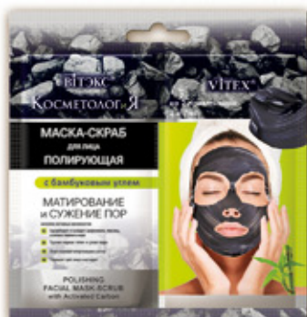
4. ПОЛИРУЮЩАЯ МАСКА-СКРАБ для лица с бамбуковым углем