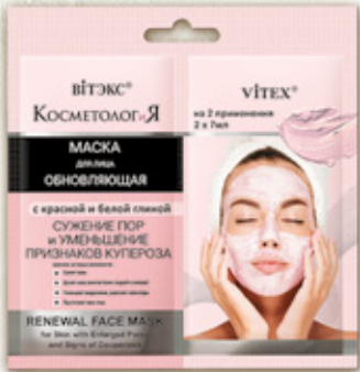
10. ОБНОВЛЯЮЩАЯ МАСКА для лица с красной и белой глиной