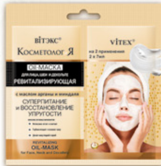
11. РЕВИТАЛИЗИРУЮЩАЯ Oil-МАСКА для лица, шеи и декольте с маслом арганы и миндаля