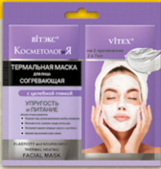
8. ТЕРМАЛЬНАЯ СОГРЕВАЮЩАЯ МАСКА для лица УПРУГОСТЬ и ПИТАНИЕ

СДВОЕННОЕ саше рассчитано на 1 применение 2x7мл