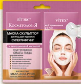
9. СУПЕРЛИФТИНГ МАСКА-СКУЛЬПТОР для лица, шеи и декольте с гиалуроновой кислотой