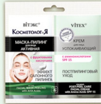
12. Активная МАСКА-ПИЛИНГ для лица с фруктовыми кислотами + УСПОКАИВАЮЩИЙ КРЕМ для лица SPF15